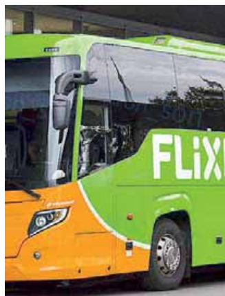
Un pullman di FlixBus

sce vino, musica e mostre culturali. Per chi in estate ama esplorare le città d'arte, a Bologna spettacoli in Piazza Maggiore e cene al lume di candela. Il capoluogo emiliano offre una serata dedicata alle stelle pensata ad hoc per ogni visitatore. Per chi ha in programma di trascorrere le vacanze in una località di mare, per esempio, Pescara è offre lidi, feste con musica e dj, spettacoli, appuntamenti volti a raccontare la nascita e l'evoluzione delle stelle. Pioggia di stelle cadenti anche nelle calette di Monopoli