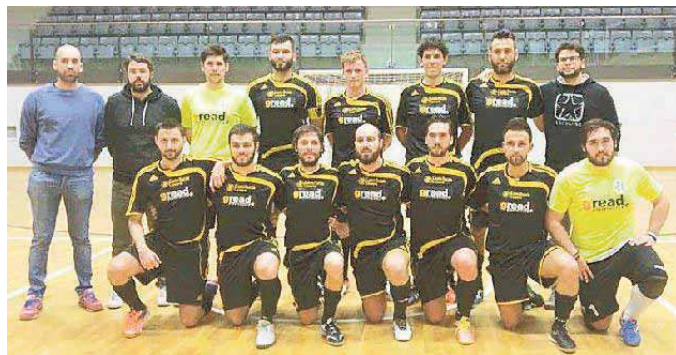
Foto di gruppo per il nuovo Sacco San Giorgio