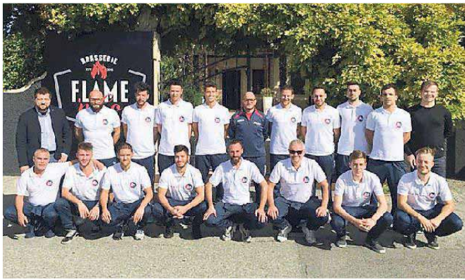
L'Olympia Rovereto è reduce dalla sconfitta di Prata