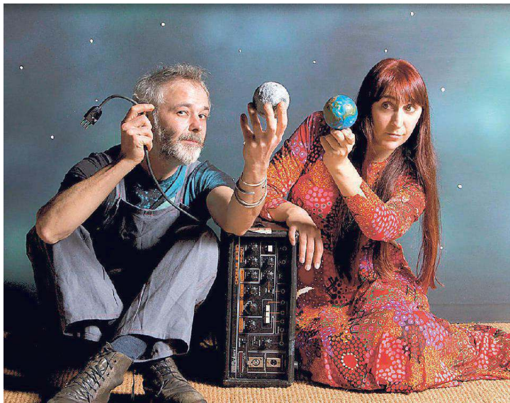
I Grimoon planano al Forte delle Benne di Levico con il loro mix di rock, psichedelia e animazione digitale

In questi anni hanno suonato tra Europa e Stati Uniti, moltiplicando le collaborazioni con artisti italiani e stranieri