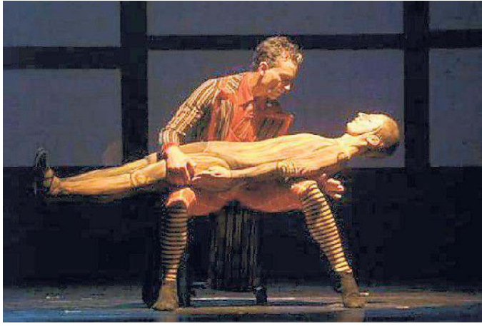
Una scena di «Pinocchio», stasera al Paladolomiti di Pinzolo dalle ore 21