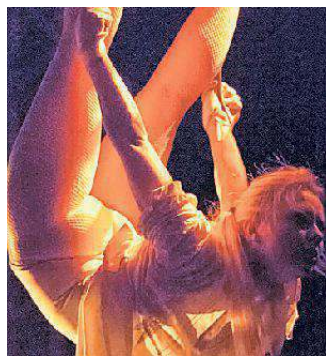
Una scena dello show

Torna lo spettacolo più folle. Da questa sera e sarà in replica fino al 23 luglio, ore 21, all'Ex Zuffo torna Psychiatric Circus. Psychiatric è il nuovo spettacolo di circo-teatro della storica famiglia circense Bellucci-Medini. Un evento folle e divertente per un cast internazionale di acrobati, ballerini, cabarettisti, attori, pagliacci, appartenente alle più prestigiose scuole di Torino, Flic e Grugliasco, dal circo di stato di Bucarest, Montreal e Londra, che presenterà numeri tecnicamente difficilissimi, costruiti con una chiave ironica ed insieme inquietante. Artisti di altissimo livello saranno in scena con un gioco di incastri tra acrobatica al suolo e al trampolino, verticalismo, facherismo, contorsionismo, manipolazione, fantasma e folle comicità per regalare agli spettatori risate di puro terrore. Uno spettacolo