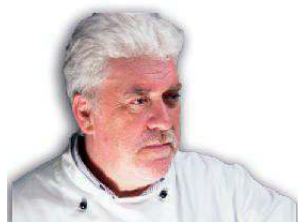
LA CUCINA DI ANDREA BASSETTI www.andreabassetti.it

Wonder Woman di Patty Jenkins con Gal Gadot Ore: 21.00