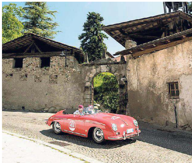
Gnudi - Jannuzzi su Porsche 356 Speedster

Tanti chilometri non sono comunque riusciti a scalfire, almeno per quanto riguarda le prime tre posizioni, la classifica generale delle vetture storiche, che vede ancora al comando la coppia Passanante - De Alessandrini su Fiat 508 C con 212,35 penalità, seguita da Fontanella - Covelli su Ford B Roadster (239,40 penalità), da Mozzi - Biacca su Triumph TR2 (313,10), da Giacoppo - Grillo-